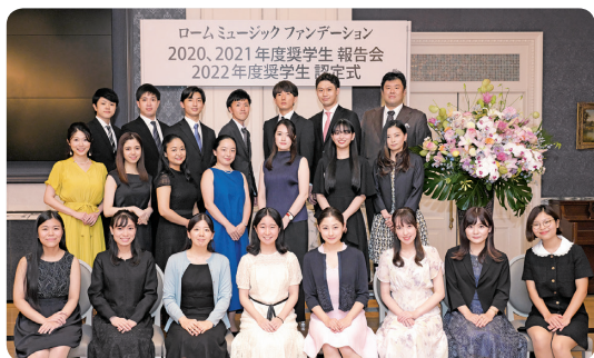
認定式・報告会(2022年)

奨学生に採択された方は、スカラシップ コンサートのほか、認定式・報告会、懇親会、アーティスト研修会などさまざまな行事にご参加いただくことができます。