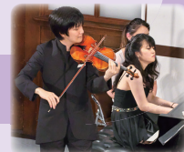
成田達輝【ヴァイオリン】 萩原麻未【ピアノ】