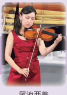
尾池亜美 【ヴァイオリン】